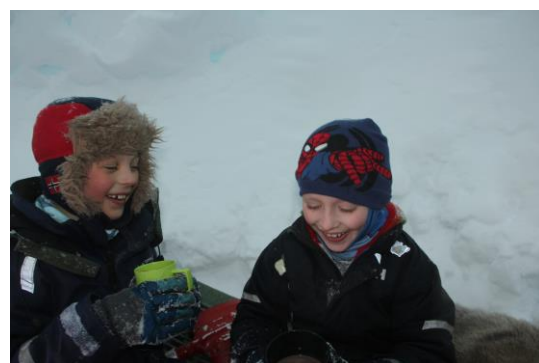
To gutter som koser seg på reinsdyrskinn i igloen på Tellbreen.