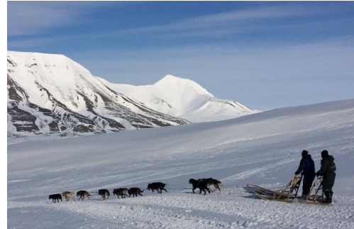
Dobbelsleden i bruk – her av 2 voksne – hvor begge aktivt kan bremse og kontrollere sleden. Det å aktivt kjøre kontra å være passive passasjer øker opplevelsen og sikkerheten. Dette gjør det også mulig for barn å kjøre under trygge betingelser sammen med en voksen.

Det er mye vær på Svalbard og spesielt vinden skaper utfordringer. For å kunne tilby barnefamilier et lunt sted å drikke noe varmt og spise litt mat har vi under dette prosjektet gått til innkjøp av en iglo-ballong. Denne ballongen fyller vi med luft og så ved hjelp av en snøfreser pakkes det mye snø over denne ballongen. Så lar vi det hele stå en dag eller to for at snøen skal sette seg før vi tapper ballongen for luft og drar den ut av snøhaugen. Resultatet blir en snøhule/iglo. Denne har plass til 8-10 personer og ble en stor suksess for både voksne og barn på våre mange sledeturer denne våren. Disse igloene er perfekte da de gir god ly for vinden og det uten «telt-blafring», samt at de også er varme med temperaturer sjelden kaldere enn 0°C. Vi satt opp totalt 2 stykk: en oppe ved isgrotta i Scott Turner breen (Bolterdalen) og en ved isgrotta på Tellbreen. Neste sesong planlegger vi å sette opp flere.