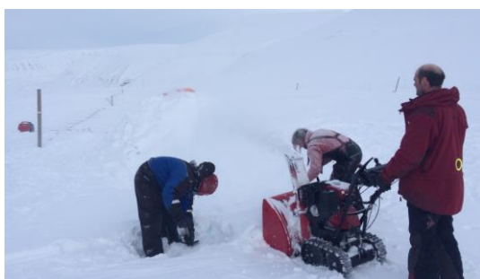
Laging av igloo der snø freses over en ballong som skimtes så vidt i rødt på toppen.

Det er mye vær på Svalbard og spesielt vinden skaper utfordringer. For å kunne tilby barnefamilier et lunt sted å drikke noe varmt og spise litt mat har vi under dette prosjektet gått til innkjøp av en iglo-ballong. Denne ballongen fyller vi med luft og så ved hjelp av en snøfreser pakkes det mye snø over denne ballongen. Så lar vi det hele stå en dag eller to for at snøen skal sette seg før vi tapper ballongen for luft og drar den ut av snøhaugen. Resultatet blir en snøhule/iglo. Denne har plass til 8-10 personer og ble en stor suksess for både voksne og barn på våre mange sledeturer denne våren. Disse igloene er perfekte da de gir god ly for vinden og det uten «telt-blafring», samt at de også er varme med temperaturer sjelden kaldere enn 0°C. Vi satt opp totalt 2 stykk: en oppe ved isgrotta i Scott Turner breen (Bolterdalen) og en ved isgrotta på Tellbreen. Neste sesong planlegger vi å sette opp flere.