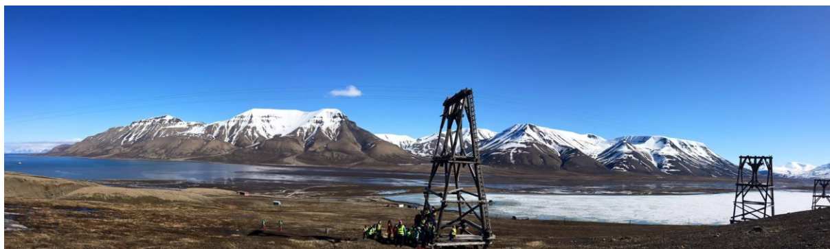
Troels tok med skoleklassen på tur til en av Topptrimkassene for barn og unge. Læring i friluft er en unik måte å møte elvene på der barna blir mer fysisk aktive, får naturkontakt og forståelse av samspillet mellom natur og menneske.

Postkassene ble plassert halvveis til Sukkertoppen, halvveis til Varden, Morena i Longyearbreen, Gruve 2b (ble flyttet etter stenging av gruva) og Taubanebukken ved Isdammen.