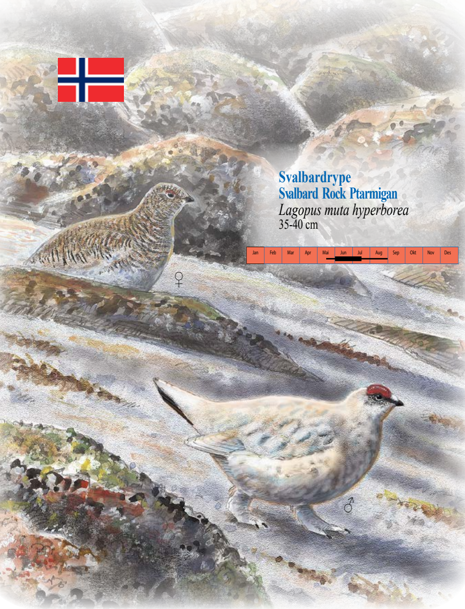
Svalbardrype Svalbard Rock Ptarmigan Lagopus muta hyperborea 35-40 cm