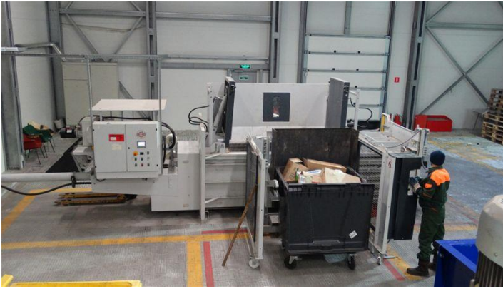
Foto nr. 5. Ballepressen