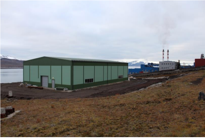
Foto nr.1 Gjenvinningsanlegget