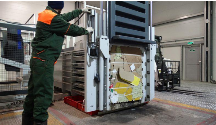
Foto nr. 6. Komprimering av avfall.