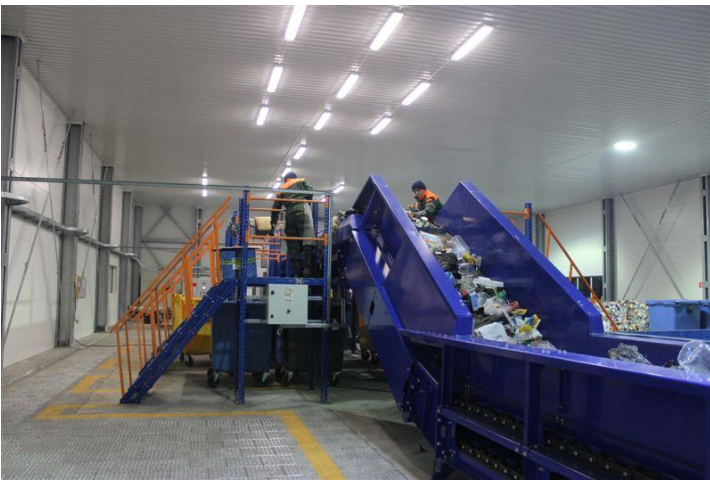
Foto nr. 3. Anleggets sorteringslinje