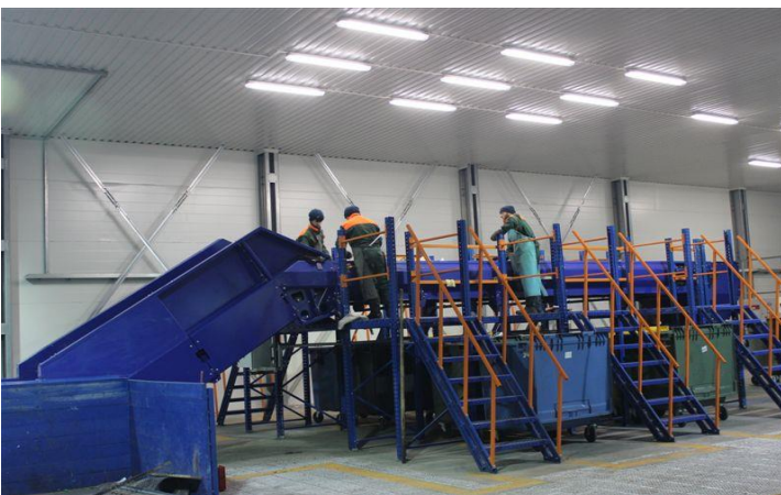
Foto nr. 4. Anleggets sorteringslinje