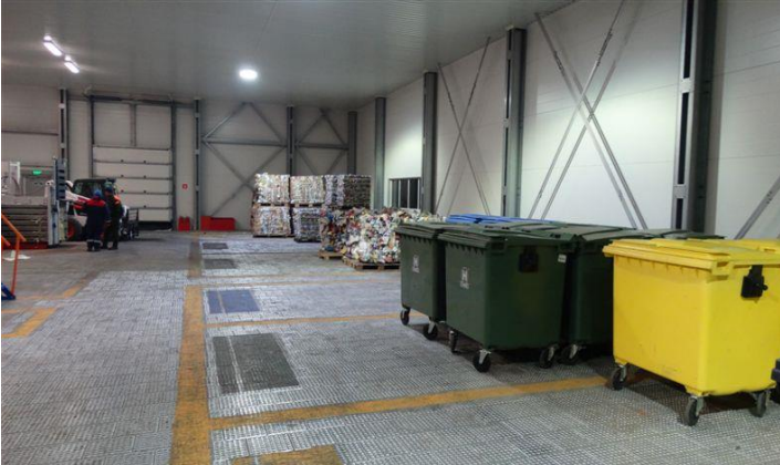
Foto nr. 7. Midlertidig lagring av de ferdige