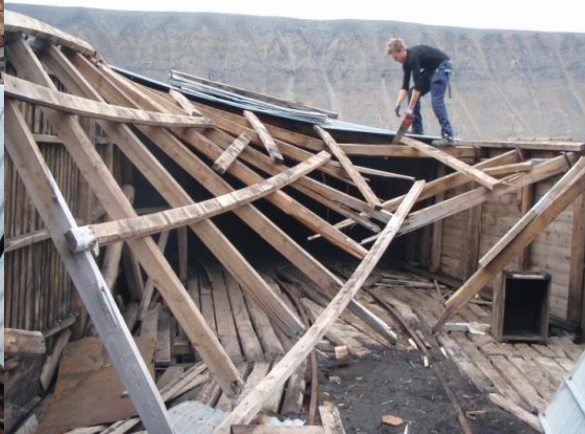
Riving og rydding av ødelagt takinnfesting