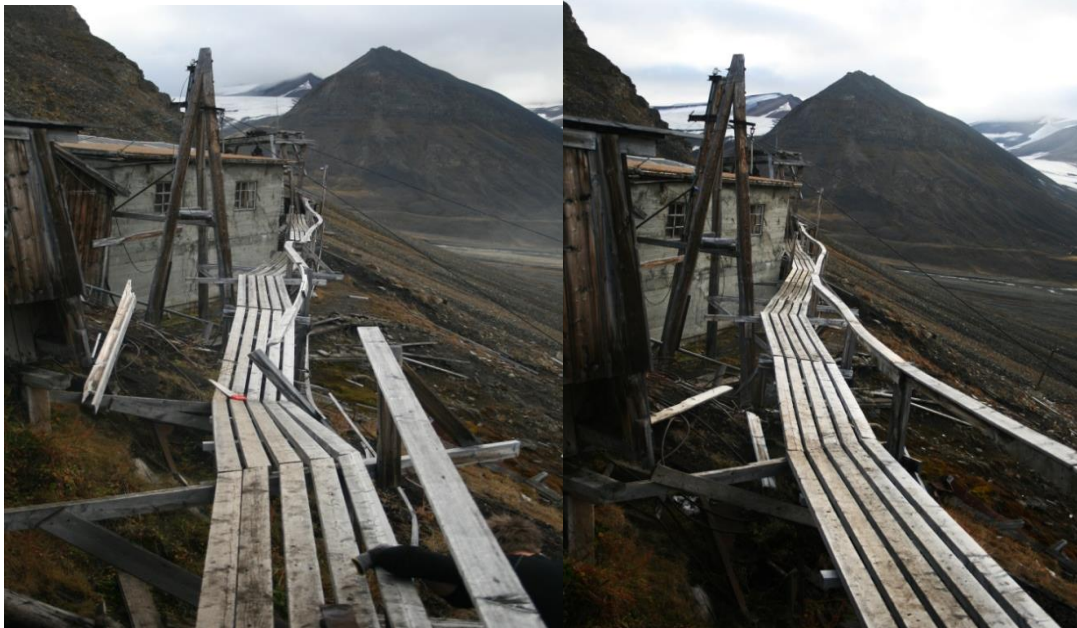
Gangbru før reparasjon

Gangbru til heis bua i nedre del av anlegget var i dårlig forfatning, og var på tur til kollapse helt. Samme var det med heis bua.