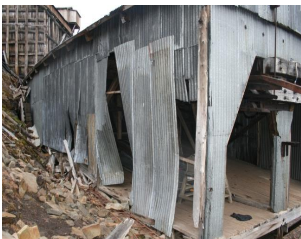
Nedre del av lasten med skader fra ras

Her var det rast inn mot øvre vegg, slik at plater og festkonstruksjon hadde store skader. Heldigvis var ikke platene blåst bort eller blitt ødelagt, slik at de kunne gjenbrukes