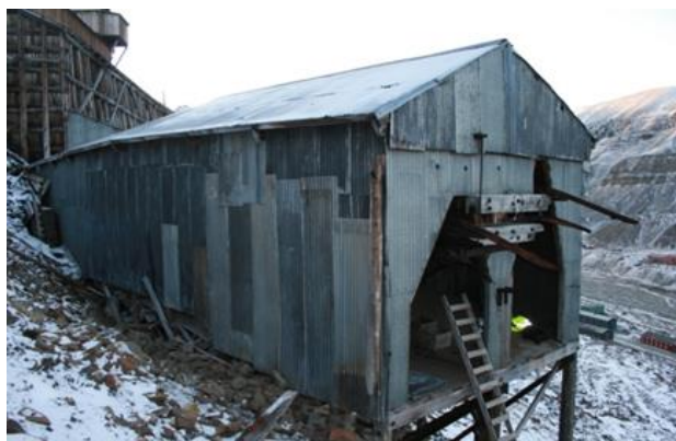
Samme sted etter reparasjon