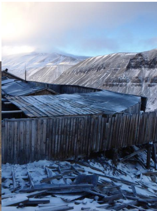
Taket på plass