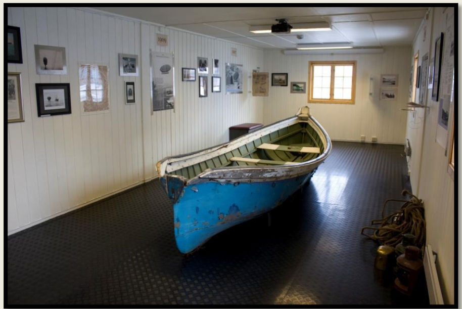
Wellman sin livbåt fra 1909 i midten av utstillingen