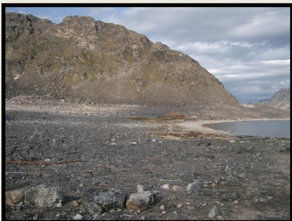
Virgohamna mot vest 2004

Formålet med jubileumsutstillingen er, foruten å markere de 100 år som er gått siden Wellmans siste forsøk, å formidle dette spesielle stedet i Arktis og dets sårbare kulturminner.