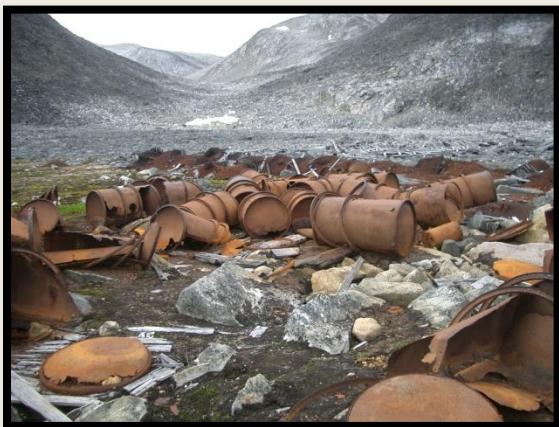
Noen av restene etter den Wellmanske industri anno 2004 (mot sør)