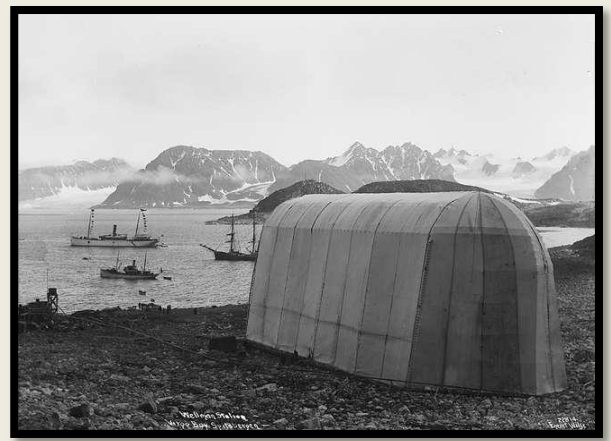
Wellmans hangar i 1909, mot nord øst