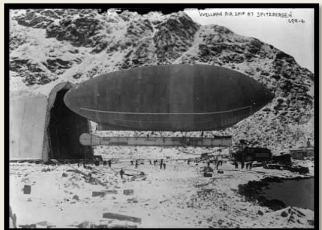
Virgohamna mot vest 1907