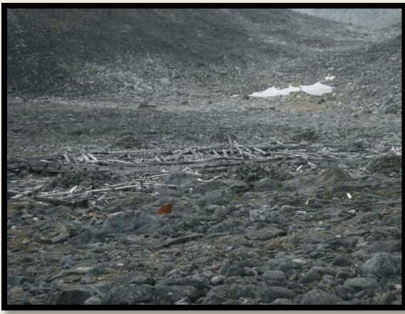
Wellmans hangar liggende i 2004, mot sør