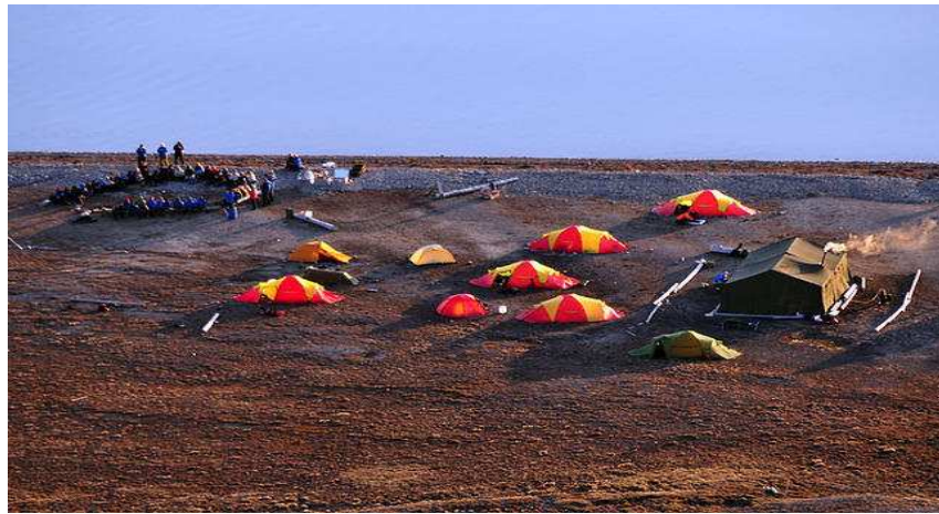
Camp Svalbard 2009

Søknaden ble skrevet etter at brukere ved ungdomsklubben og selvstyrt ungdomshus (UHU) kom med forslag om å lage en ”grønn” ungdomsklubb. Longyearbyen lokalstyre ønsket å utvikle dette til å omfatte hele ungdomsvirksomheten, dvs. alle arrangementer, turer og aktiviteter som gjennomføres i regi av ungdomsvirksomheten. Kultur og Fritidsforetaket KF arrangerte høsten 2009 Camp Svalbard, et friluftsansettment for 40 ungdommer i alderen 13 – 18 år, der fokus på klima og miljøvern sto sterkt ( Camp Svalbard 2009 - Sysseleannen ).