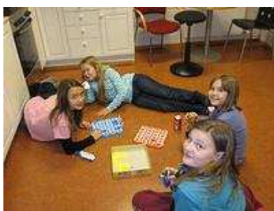
Ludo på kjøkkenet.

Siden vi nå bruker mer kopper og kar på våre klubbkvelder, samt ved utleie, valgte vi å kjøpe en oppvaskmaskin som hadde en kort programtid. Dette gjør at vi kan vaske opp flere ganger i løpet av kort tid ved behov, og forenkler bruken av dekketøy og bestikk som finnes i klubbens kjøkken.