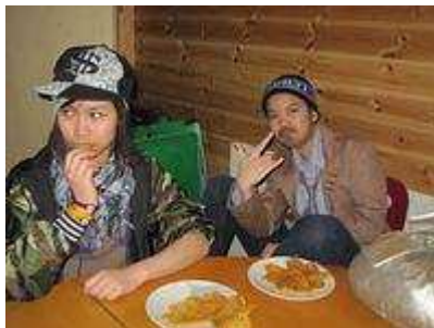
Omvendtfest på Ungdomsklubben.

På grunn av suppleringen har vi nå ikke lengre behov for å kjøpe inn engangsbestikk og engangskopper til våre arrangementer.