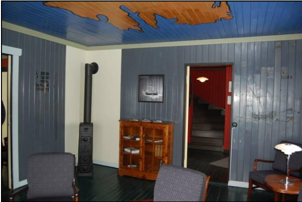
Maleriene av Gjøa og navnene får stå med synlige sår og mangler etter tidligere demontering.