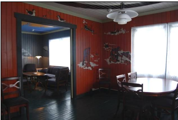
De to rommene bør behandles samlet med fokus på 1938. Kopi av linoleum bør derfor tilbakeføres i begge rom.