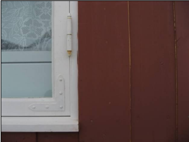
Bildet viser umalte glipper i panelet. Vi ser også at vinduet er montert for tett mot sidekarmen. Dette vil forårsake kapillærsug.