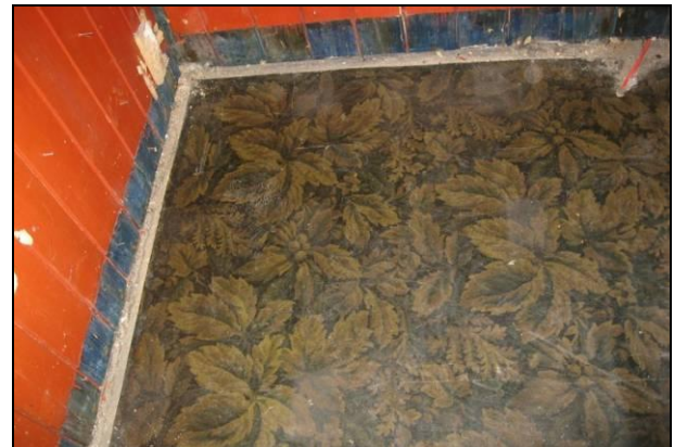
Avdekket linoleum, som nå er fjernet, i rom 115.