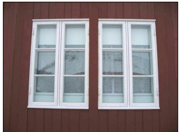
Vinduene må sjekkes nærmere på ettårsbefaringen.