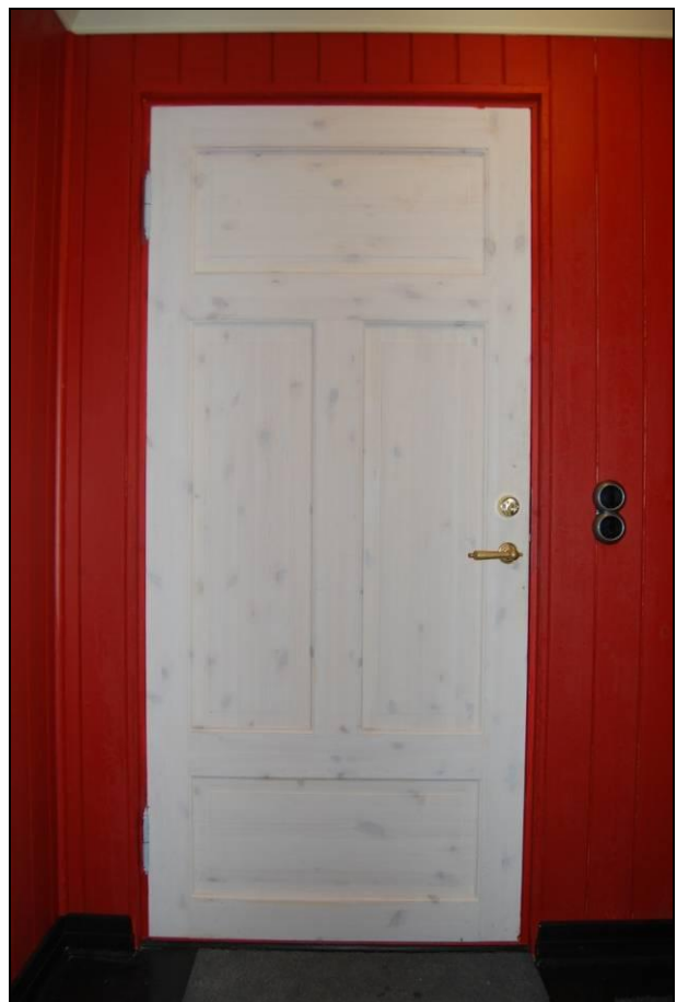
Innerdør med synlig kvist må males med tre strøk.