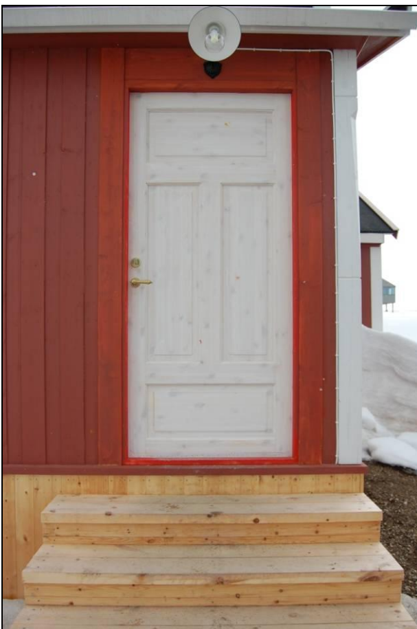
Ytterdør med synlig kvist må males med tre strøk.