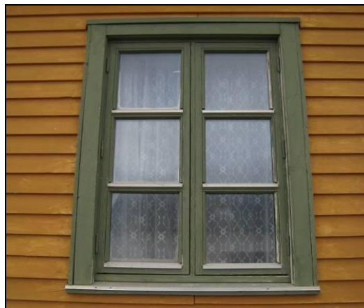
Amundsenvillaen. Mulighet for tilbakeføring/avdekking av opprinnelig panel. Dette kan gjøres på dokumentert grunnlag. Vinduenes plassering og utførelse er endret og kan tilbakeføres på sikkert grunnlag mht. plassering (tegninger, fotografier, spor i veggen). Detaljutformingene må eventuelt skje på analogt grunnlag, dvs. basert på opprinnelige vinduer med tilsvarende utforming annet sted i Ny-Ålesund.