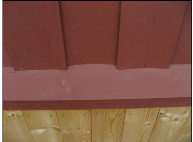
Panelet er montert med margin innover og krummer "feil vei".