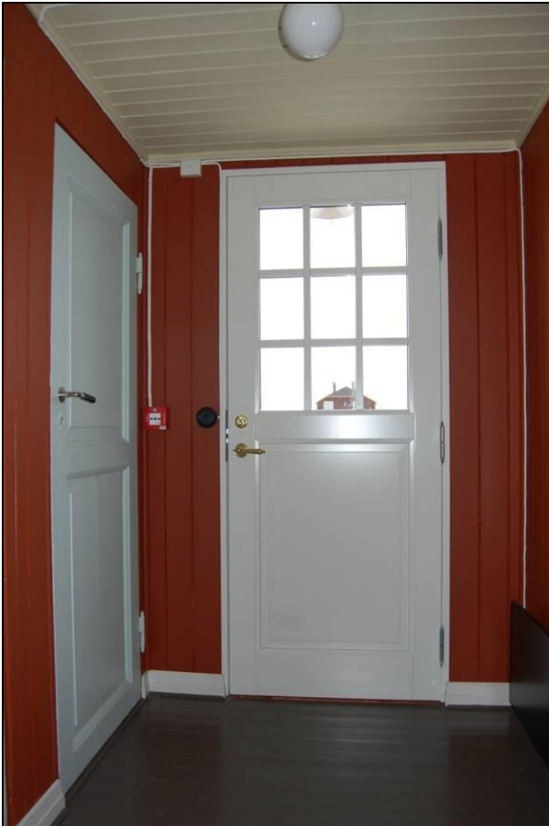
Ytterdør tilbygg vest med isolerglass må skiftes til tradisjonell utførelse.