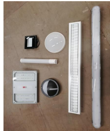
Eksempler på armaturer som ble brukt

Ved å bytte ut gamle armaturer med nye moderne LED armaturer, så har dette medført forbedret arbeidsmiljø og sikkerhet ved LNS Spitsbergens arbeidsplasser.